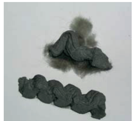
PCB i fogar

Vi tar emot prover i vår reception och det går även bra att skicka material till oss. Förpacka det väl i påsar, lägg i ett vadderat kuvert och bifoga beställningsblanketten som finns att ladda ner på vår hemsida.